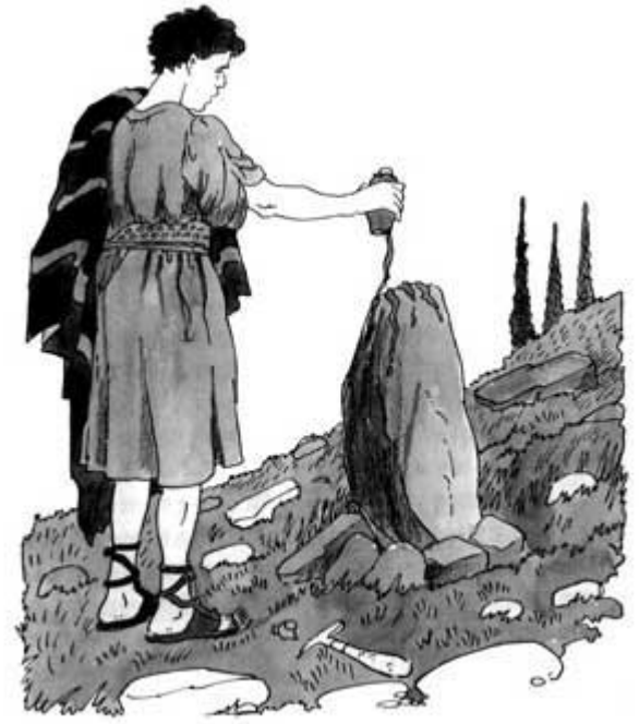
雅各澆油在石頭上