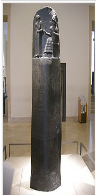
卢浮宫内的汉谟拉比法典