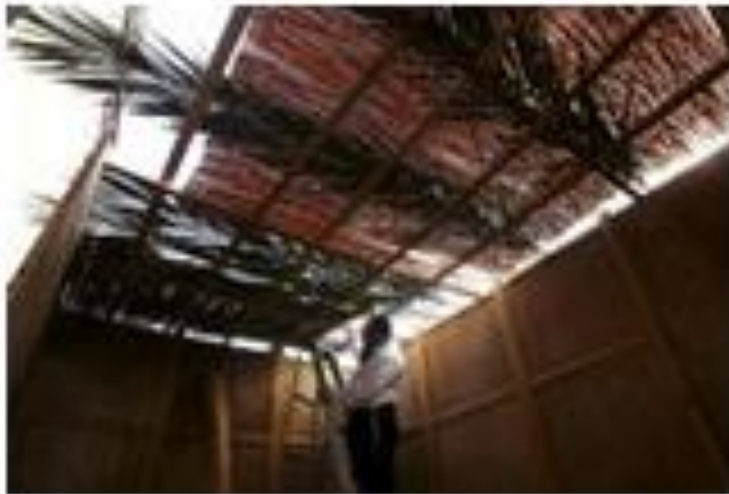
Orthodox Jews Prepare For Sukkot Festival