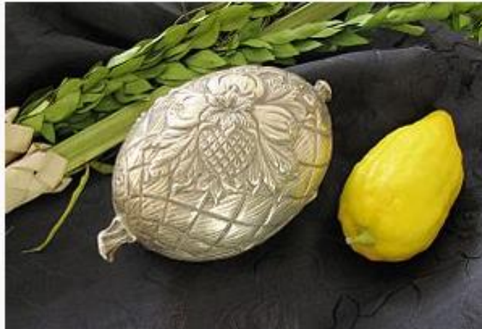
From left to right, lulav, etrog carrier, and etrog used on Sukkot