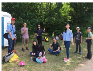
我們參與其中一個小組的採草莓活動