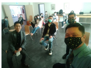
恢復實體崇拜的第一個主日