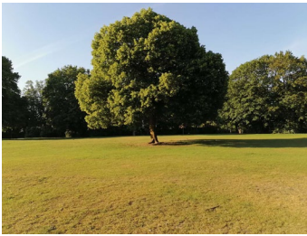
街邊公園，祈禱默想， 走路健身，身心兩益

疫情綿延數月，世界被按下暫停鍵。喧囂黯然停止腳步，寧靜找回一席之地。從朝夕奔忙運作到，慢慢到浮生半日閑，在園中與祂同行，享受上帝造物之美妙，思想救主之恩情，清心貼近耶穌懷中，唯有主自己才是我心真正滿足。事工暫時被放下，重擔全然卸在基督腳前。無需東籬采菊，無需杜康解憂，悠然見恩主慈容，心滿意足！人生單行道，沒有撤回鍵，歲月悄悄走過，寂靜無聲。疫情讓我更渴慕親近祂，這豈非基督的美意與恩典？感恩！主啊，我但求以終為始，不忘初心，竭誠為祢，將萬事看作糞土，為要得著基督。