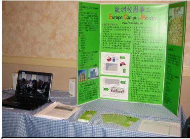
华人宣教动员大会'08 旧金山, ECM 展览摊位

2008 年底营会结账以后, 大致奉献和支出都在美金七万五左右, 感谢主的预备和肢体在爱心中的奉献。