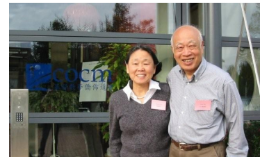
大胜致渝参加伦敦 基督教华侨布道会 国语事工研讨会

谢谢你忠心的代祷支持, “上陣的得多少, 看守器具的也得多少。”愿主祝福你和你的教会, 多多加添你们仁义的果子。以马内利! 主恩满溢!